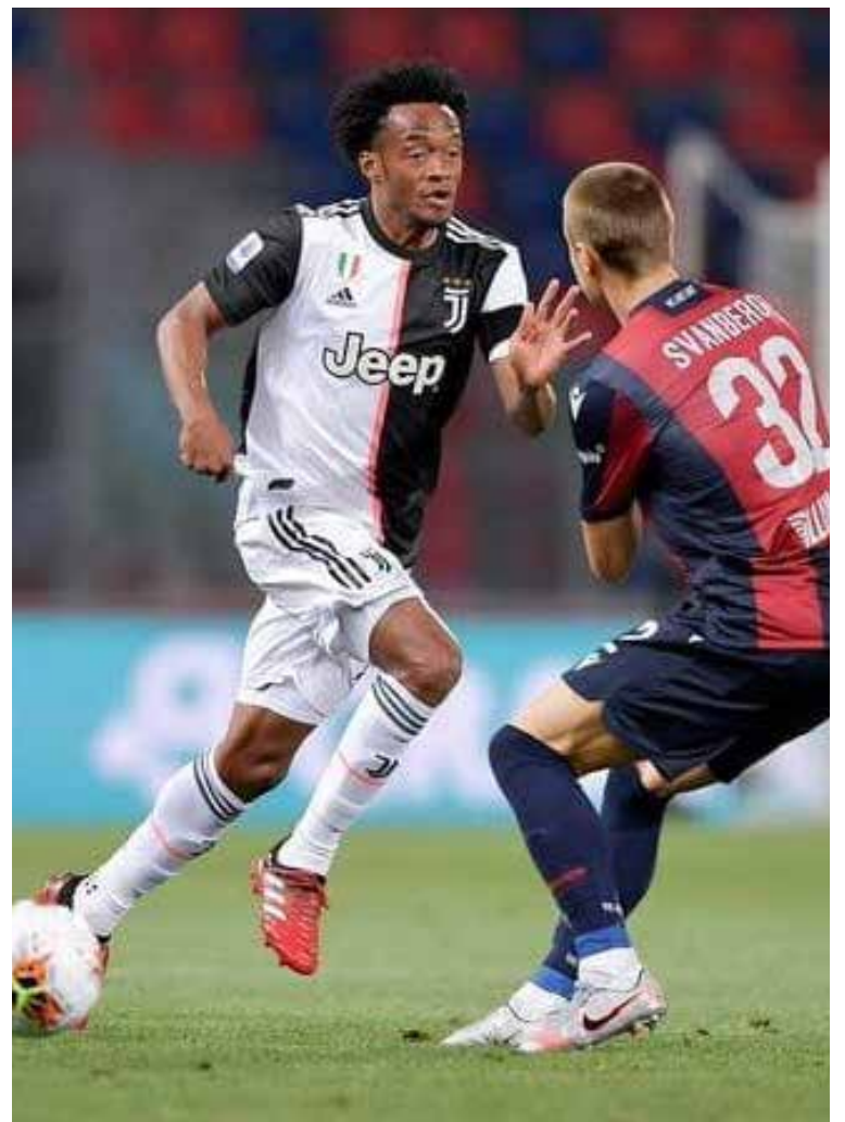
La habilidad futbolística de Cuadrado es reconocida por sus contendores.