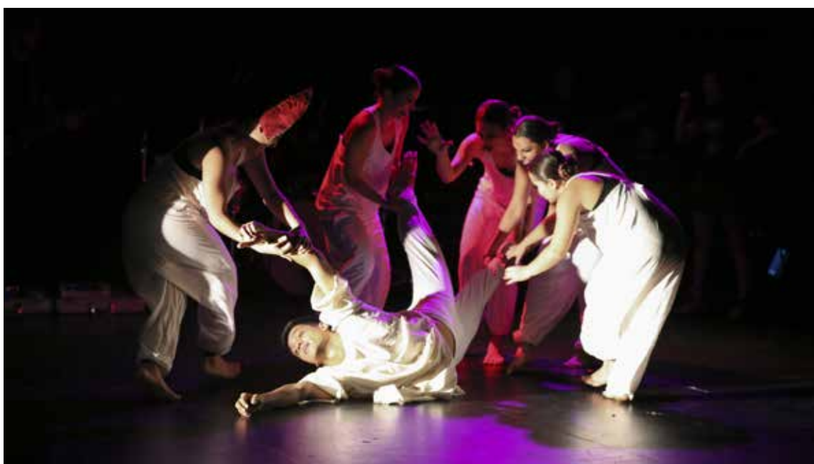
'Un nuevo contrato social y ambiental para la Bogotá del Siglo XXI' es la recuperación económica del sector cultura, recreación y deporte. Para lograrlo se invertirán $1.059.455 millones de los $2,23 billones con los que cuenta el sector para este cuatrienio.