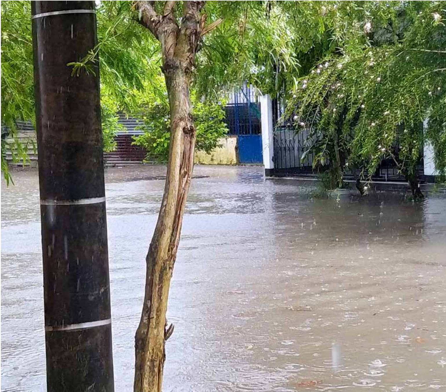
Inundación total en las calles de Puerto Inírida.

A larma causó en Puerto Inírida, el torrencial aguacero de las últimas horas. Daños, inundaciones y emergencia se vivieron en la capital del departamento de Guainía.