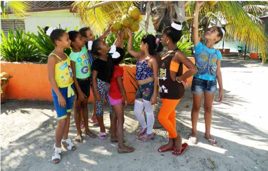
Los que saben querer, la esperanza que anunció Martí están de fiesta el tercer domingo de julio.