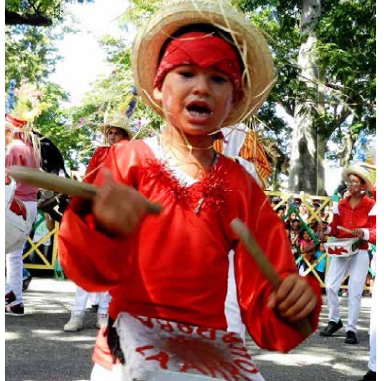
El llamado que hizo la ONU en la década del 50 del siglo pasado en diversas naciones se celebra el tercer domingo de julio el Día del niño.