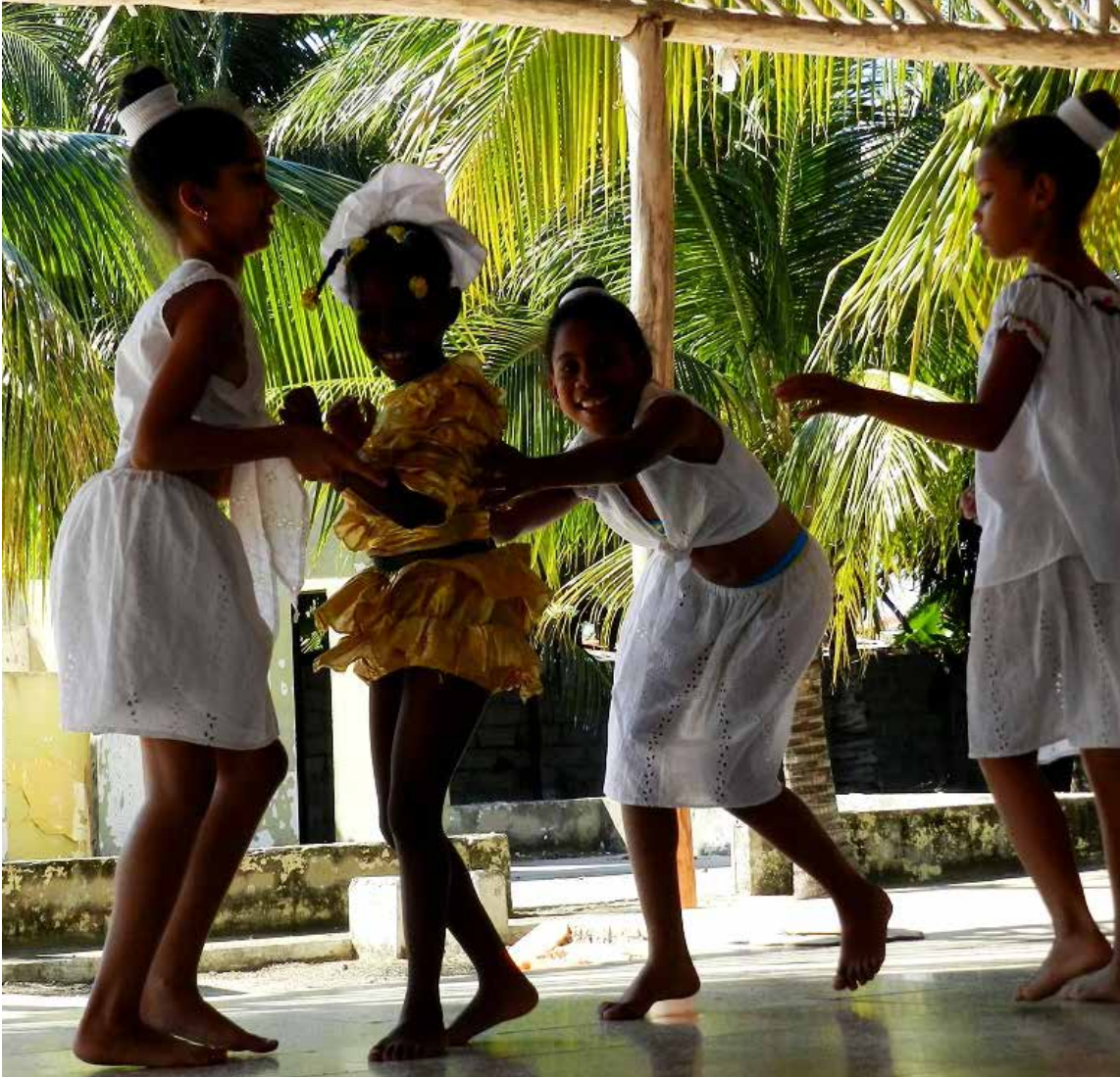
«Estará todo el mundo alegre, todo el mundo feliz, todo el mundo de fiesta»