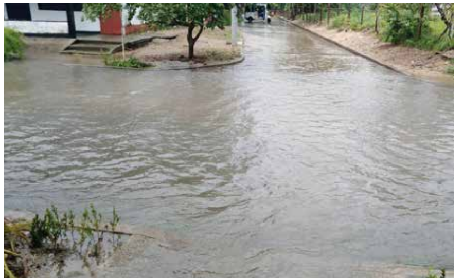
Los bomberos con escasos equipos atienden diferentes frentes.