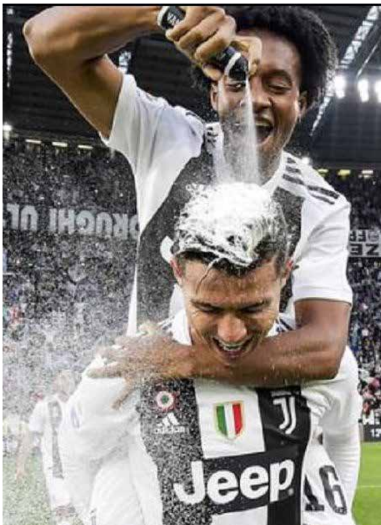
10 campeonatos de fútbol en Europa a ganado Cuadrado. Celebración del último campeonato donde celebra con su compañero y amigo Cristiano Ronaldo.