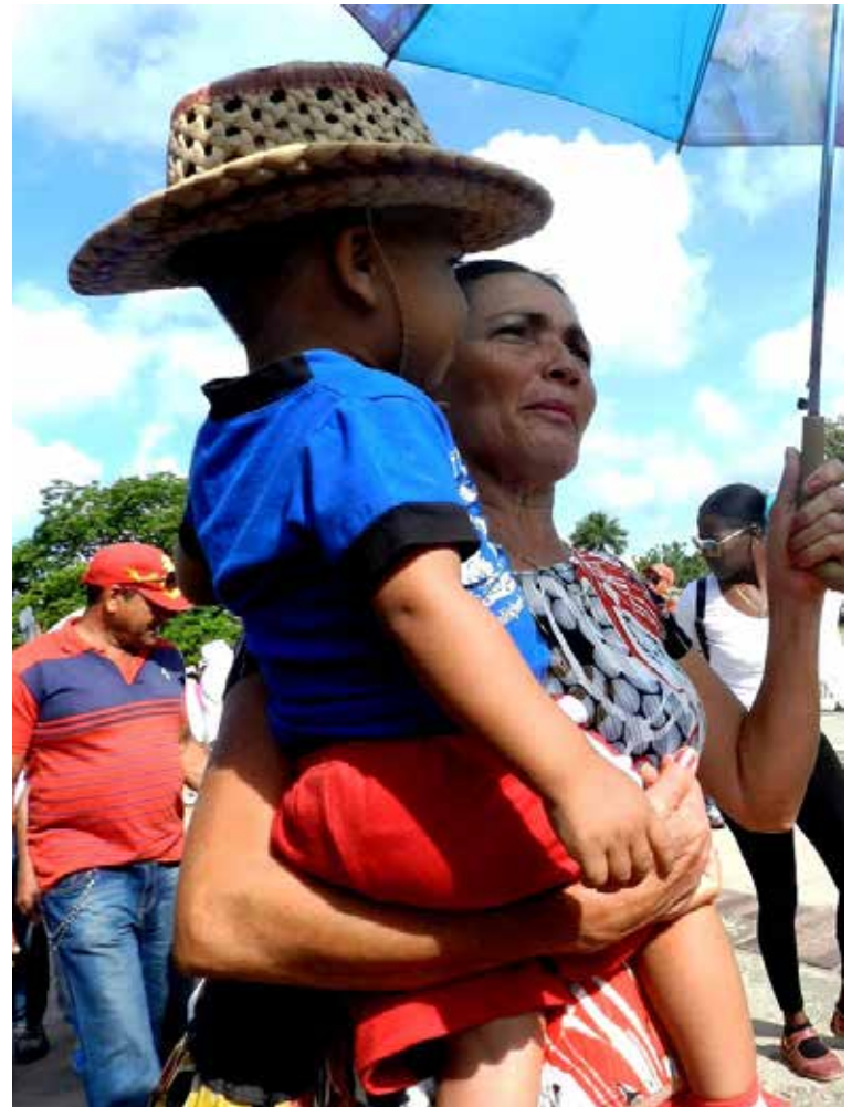
El tercer domingo del séptimo mes del año los príncipes enanos en la mayor de las Antillas, festejan el Día de los niños.