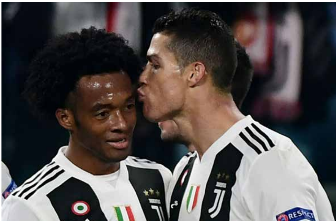
La prensa italiana asegura que Juan Guillermo Cuadrado lidera un grupo: los «Panitas», del cual hace parte Ronaldo.

de bien y no sería un actor de la guerra.