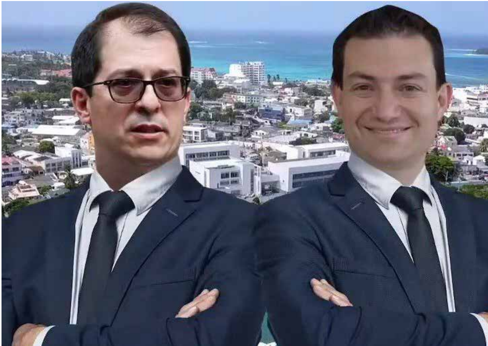
El fiscal Francisco Barbosa y el Contralor Carlos Felipe Córdoba, colegas y amigos.