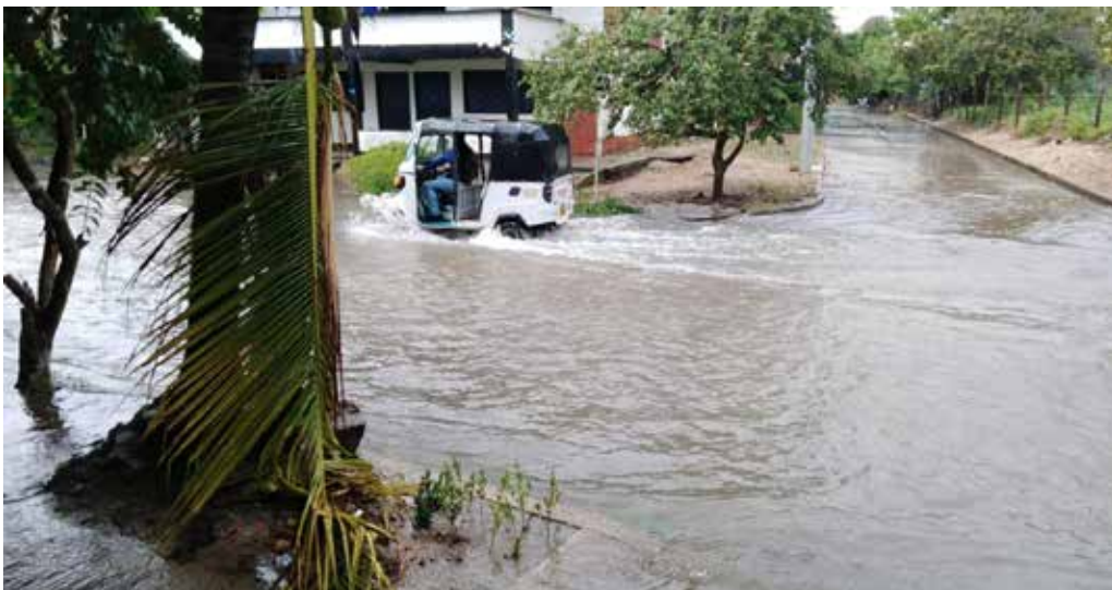
El agua ha sido un obstáculo para el transporte que se presta en mototaxis.

Se mantiene la coordinación con los organismos de riesgo y se permanece disponibles con los medios necesarios para asistir las contingencias que se puedan presentar, según el reporte de la ciudadanía.